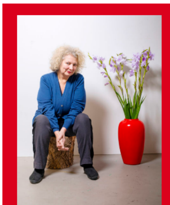
Marlene Dumas (Kuilrivier, Zuid-Afrika, 1953) studeerde schone kunsten in Kaapstad. In 1976 kwam ze naar Amsterdam. Ze werd een aantal keren bekroond. In 2012 kreeg ze voor haar oeuvre de Johannes Vermeerprijs.