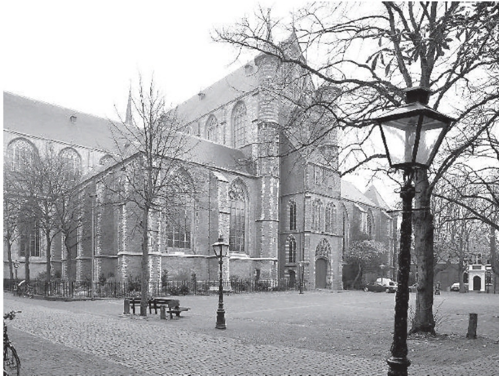
De Pieterskerk Leiden vanaf het plein gezien.

Door uitgebreid archiefonderzoek en bouwhistorisch onderzoek is zeer veel van de bouw- en gebruiksgeschiedenis bekend geworden, waarvan dit