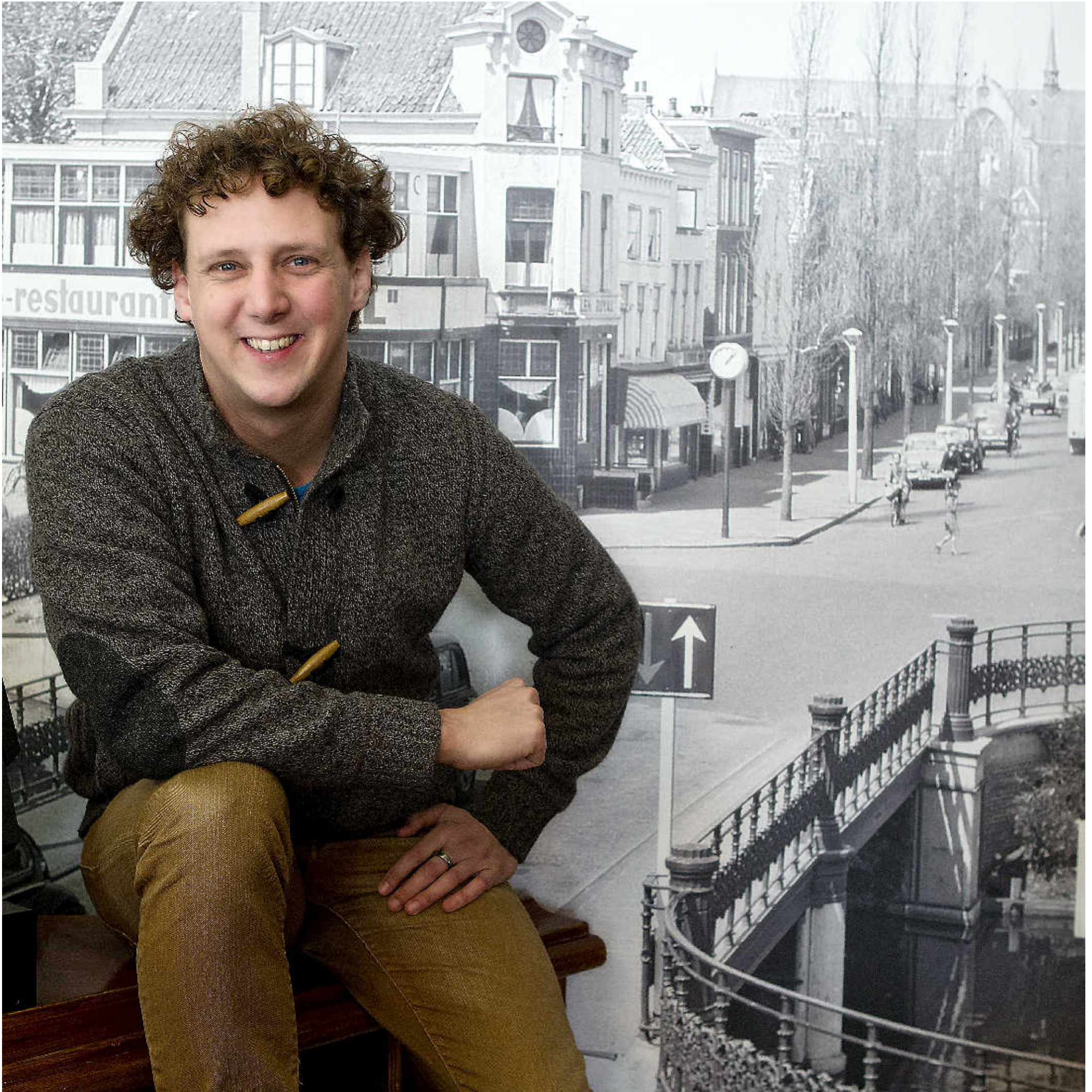
Jochem Myjer in zijn geliefde Leiden: „Als ik iets voor de stad terug kan doen, moet ik dat niet nalaten.”