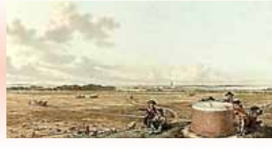
Jan Kops, de Flora en de goede grond