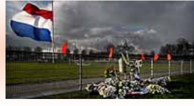
In Nederland geen week zonder moord