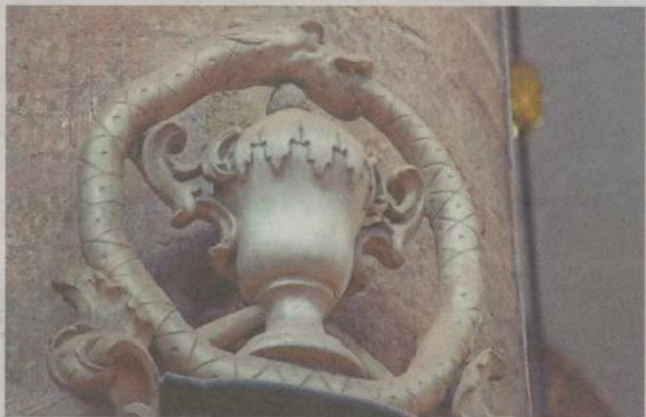
Een slang die in zijn eigen staart bijt.

den slaan. Ik heb tot nu toe geen betere verklaring kunnen vinden.” Met een beetje uitleg wordt het rondlopen door de kerk een stuk leuker. Al die lieve engeltjes? Stuk voor stuk huilen ze tranen met tuiten. Eén engeltje is zo kapot van verdriet dat het zich de haren uit het hoofd trekt. En een grote grafsteen voor een 17-jarige jongen die geboren was op Ceylon en die in Leiden overleed? „Ja, dan vraag ik me af wat voor verhaal daar achter zit. Het blijkt te gaan om de zoon van de gouverneur van Ceylon die hier in Leiden kwam studeren. Zijn moeder heeft zich trouwens nog behoorlijk verrijkt met illegale handel. Ja, dat zijn leuke verhalen.”