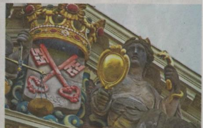
Prudentia op het Gravensteen.

Terug naar de kerk voor nog één raadsel. Tegen de muur staat een enorme grafsteen van twee bij drie meter. De slijtage laat zien dat de steen eeuwenlang onderdeel was van de kerkvloer. Van den Broek verklaart een aantal details. „Kijk, dat zijn de drie schikgodinnen, de eerste spint het garen, de tweede meet de lengte af, de derde knipt de draad door. Verder zie je weer twee omgekeerde toortsen en os-