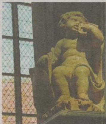
Een engeltje huilt tranen met tuiten.