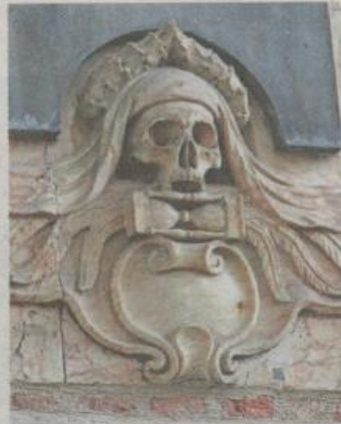
Doodshoofd en zandloper.