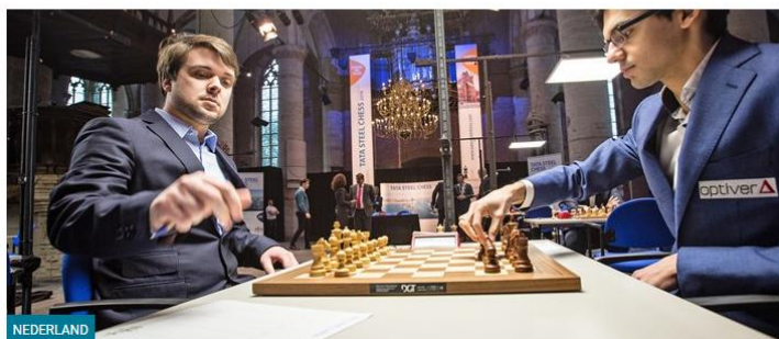
Giri Anish (rechts) strijdt tegen Vladimir Fedosejev in de tiende ronde van het Tata Steel-schaaktoernooi in de Pieterskerk in Leiden.