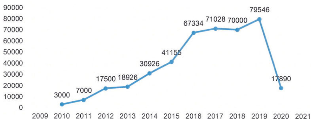
grafiek 2 – inkomsten entree monument 2010-2020