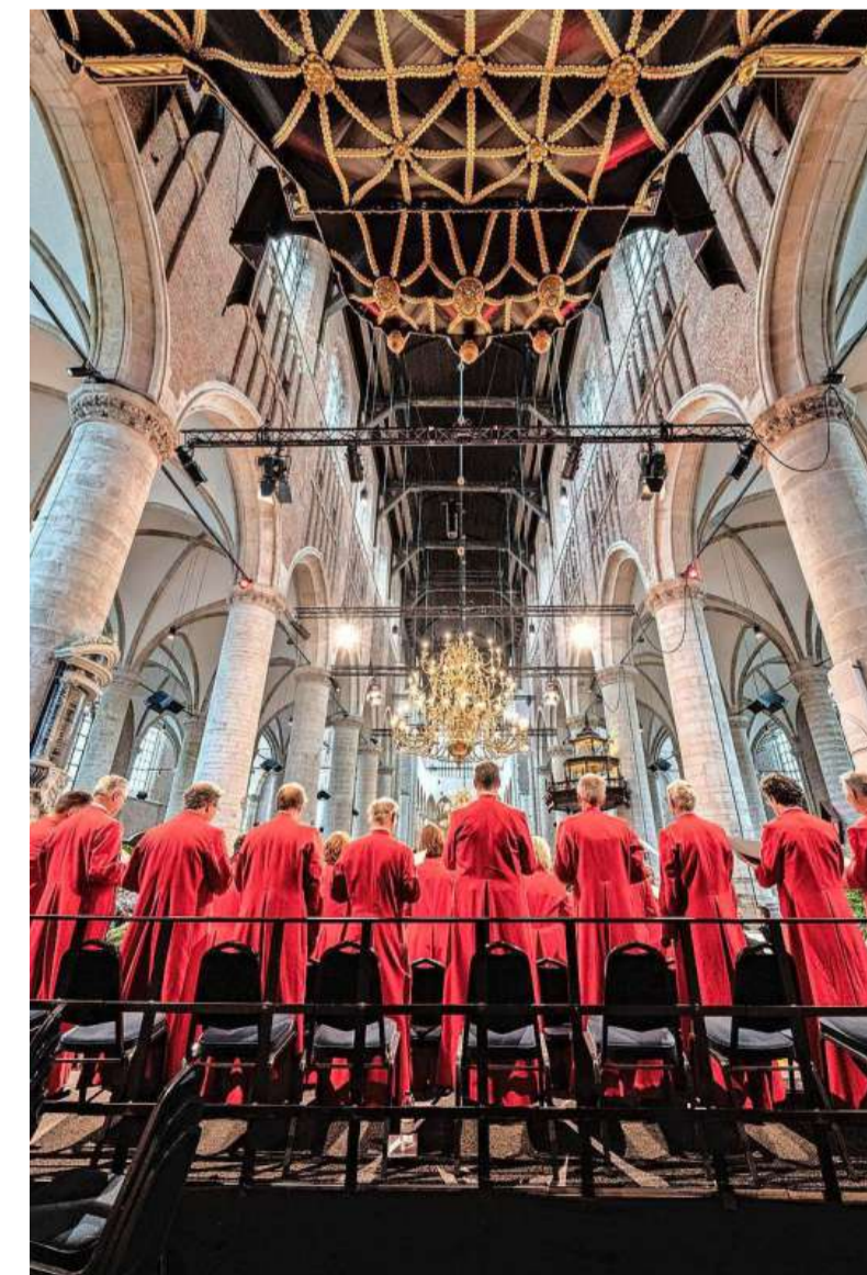
...terwijl het koor aan het werk was.