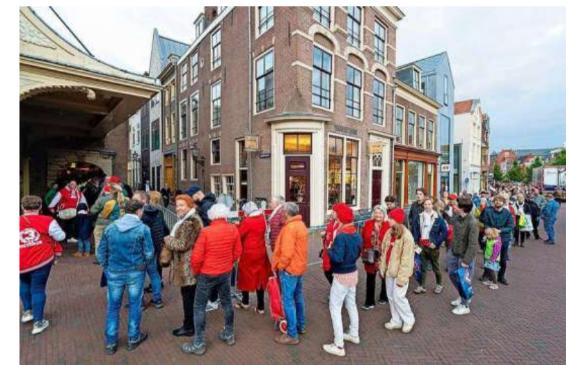
Lange rijen voor haring en wittebrood in De Waag.