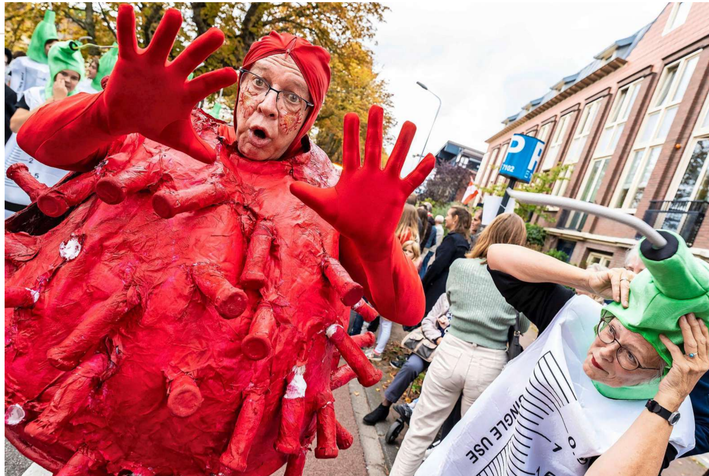
Het thema dit jaar - 'Echt Waar?!' - gaf de deelnemers aan de optocht de ruimte om allerlei grappen