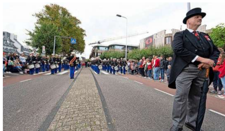
Drukte langs de route van de optocht.