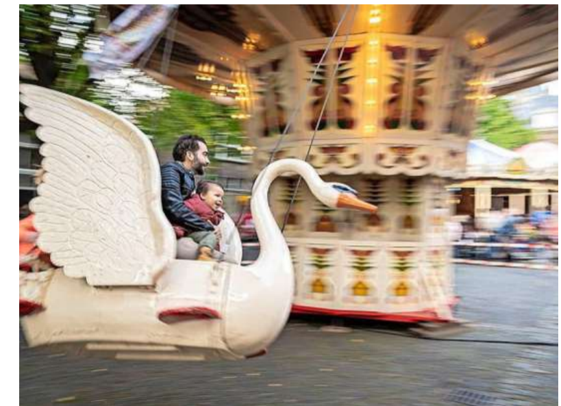
Voor de allerkleinsten was er de nostalgische kermis.