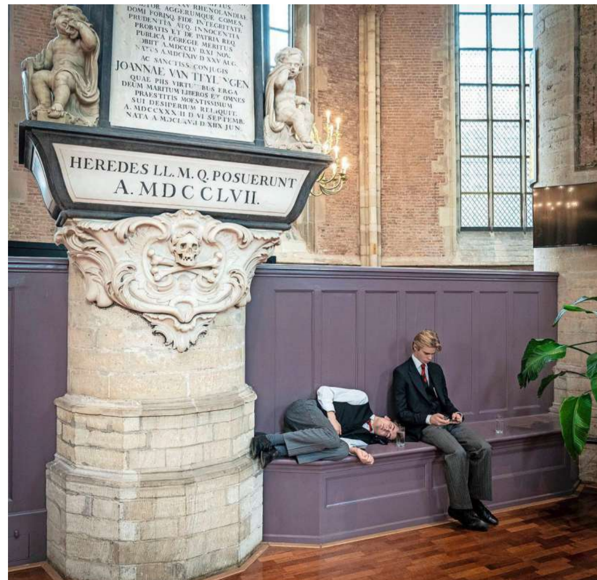
Jonge commissarissen paktten tijdens de herdenkingsdienst in de Pieterskerk even hun rust...