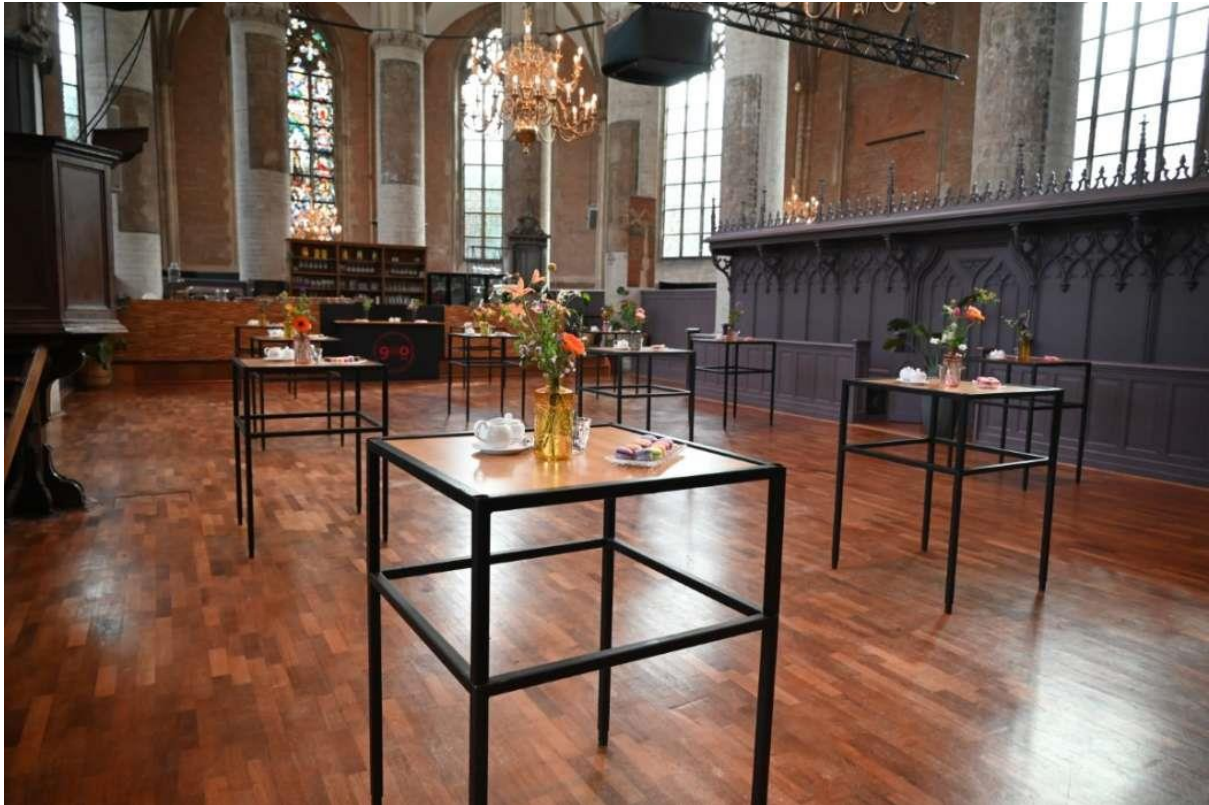
Een nog volledig lege kerk, dat zou een half uur later heel anders zijn.