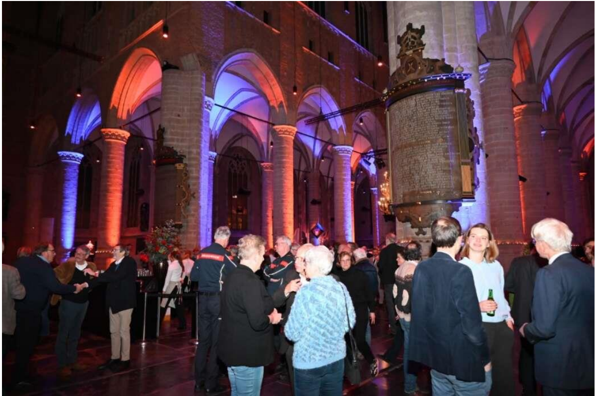
Uiteraard ook veel raadsleden zoals bijvoorbeeld de fractie, inclusief hun duo raadslid, van Studenten voor Leiden.