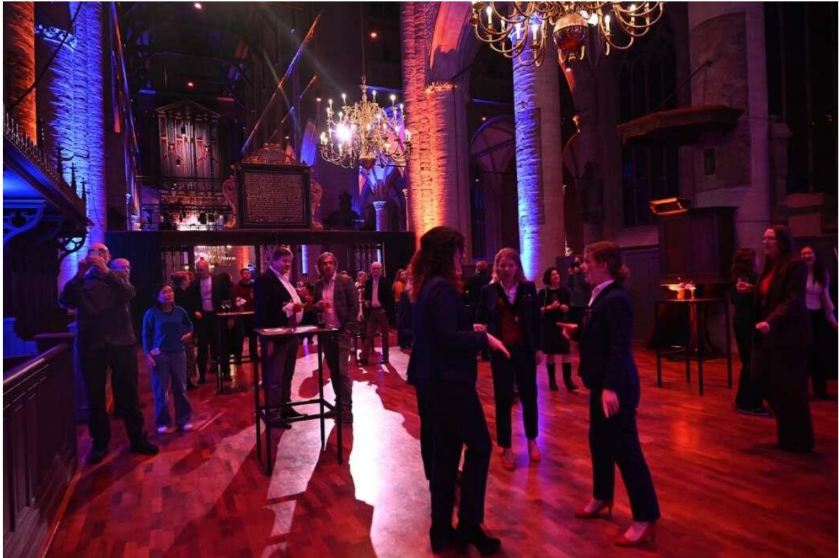
Het bleef nog lang gezellig in de kerk en iedereen genoot van het ongedwongen karakter van de avond.