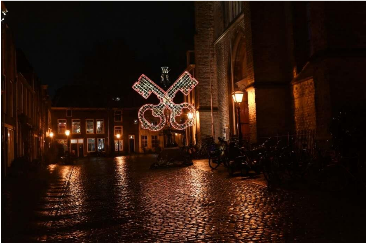
Het was dit jaar even wennen, het gebruikelijke concert voorafgaand aan de receptie was er niet en de indeling van de ruimte in de kerk was anders.