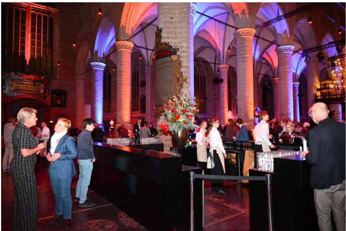
Er was weer een doorsnee van Leiden aanwezig.