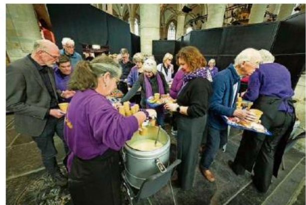
Deelnemers tijdens de lunchpauze.